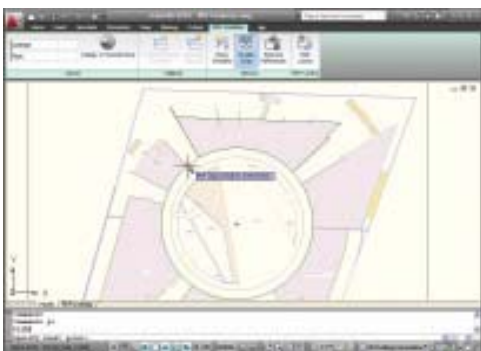
Importación y calco de archivos PDF.

Con el enorme número de mejoras realizadas para agilizar la comunicación, jamás ha sido tan fácil compartir y reutilizar los diseños. Es posible publicar archivos PDF directamente desde los dibujos de AutoCAD, así como enlazar y referenciar archivos PDF como calcos subyacentes.